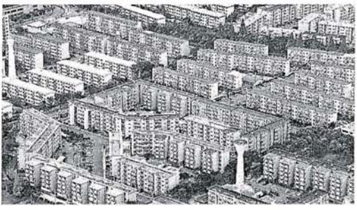
大阪府の規模を誇る府営住宅群。市北区、本社へりから、荒元忠彦撮影

財源難、超高齢化、低所得者の増大。山積する難題に、公営住宅が「ええきれなくなつてい