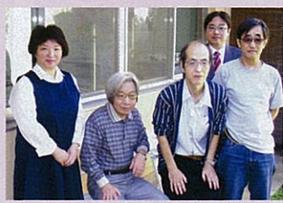
NPO法人 人と人をつなぐ会のスタッフ

百人町3、4丁目にある大規模都営団地「戸山団地」。高齢者の入居が増加したこと等に伴い急速な高齢化がすすむ一方、住みやすい環境づくりをめざして助け合いの活動をしている住民の方々がいます。今回はそんな方々をご紹介します。